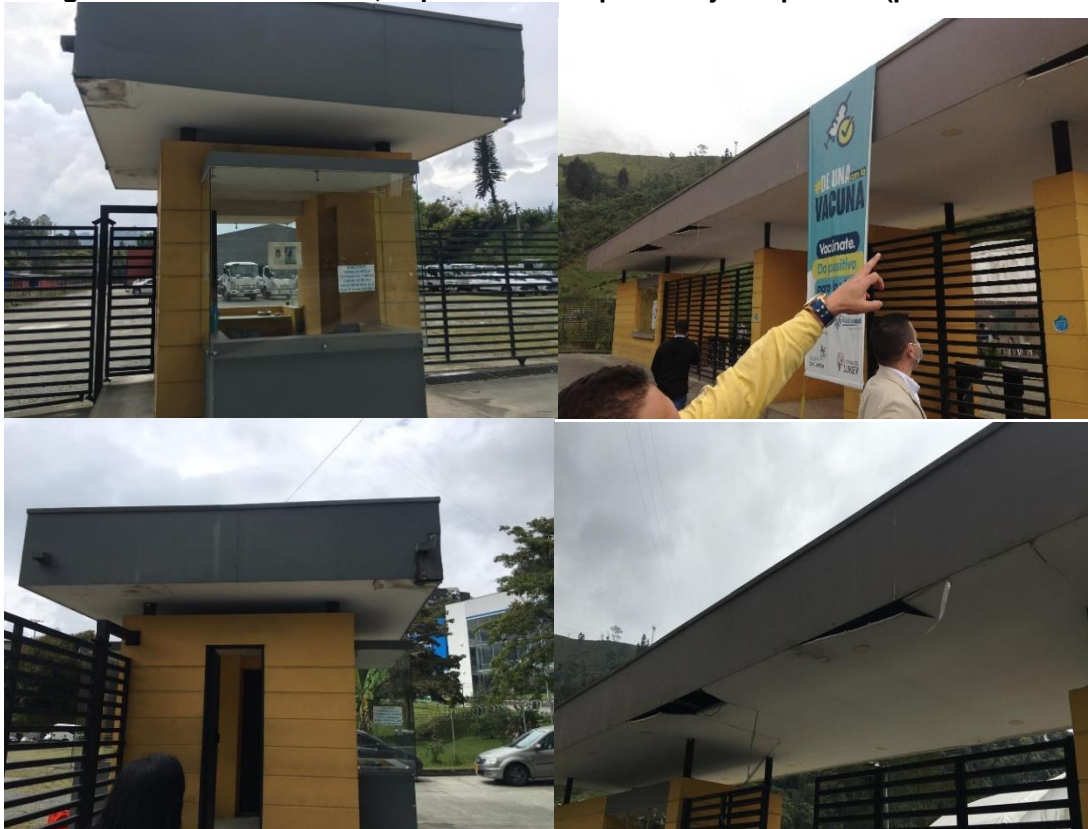
Fotografía 6: cielo raso 8 mm, super-board suspendido junta perdida (perfilería cal. 24)