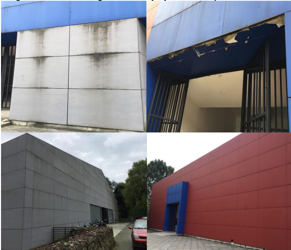
Fotografía 4: Fachada lamina gris celulósicas y drywall a la intemperie