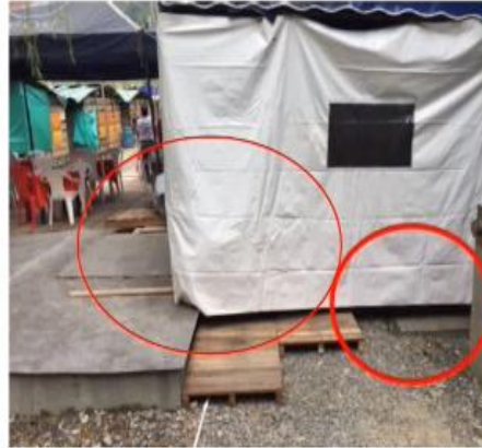
Foto 15. Instalación de elementos sobre tapa de cuarto de Bombas - Fotos Feria equina 15 de marzo de 2017